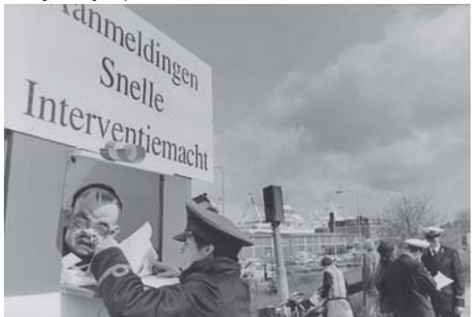
Protest tegen vlootdagen 6 april 1992

Voor bijzonderheden zie: http://stopdenavo.blogspot.com/